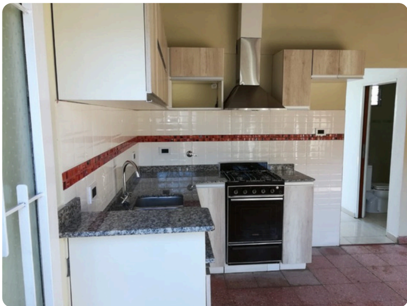
COCINA A MEDIDA